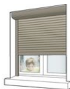
Roulants extérieurs (PVC)