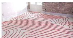
Plancher chauffant/ Rayonnement

Le mode diffusion de la chaleur joue sur le confort.