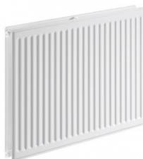
Radiateurs hydrauliques/ Rayonnement