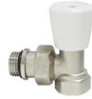
Robinet non gradué